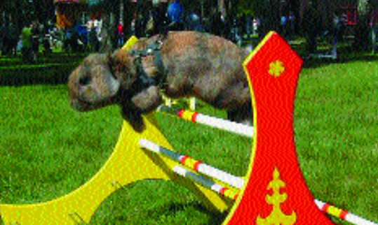
Kvikkas - japanertegnet Dvergvedder