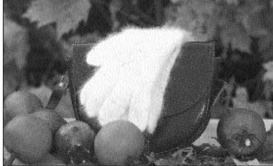
Fingervanter av angoraull anbefales i januar

Det beste er derfor også å vente med paring til 8-måneders klippet. Kanin-hunner er kjønnsmoden før den tid, men en får bedre kaninunger når mora er velutviklet. Klippingen stimulerer ofte hunnen til brunst, og en kan begynne å pare en dag etter klippingen. Hunnen settes inn i buret til hannen, eller på et egnet sted. Men uansett husk: Hannen skal aldri inn i hunnens bur. Er hunnen ikke villig til å gjennomføre en paring, tas hun vekk fra hannen. En kan vente noen timer, eller til neste dag (den beste tid på døgnet er om kvelden). Er begge villige, er en vellykket paring fort over, og en skiller dem da fra hverandre. Hunnen går så drektig i