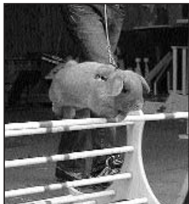
"Magic" er inne i sin første sesong som veteranhopper

Nå koser hun seg hjemme i stallen om dagene, blir vel litt veterankonkurranser på henne nå og da fremover, men ellers tar hun livet med ro.