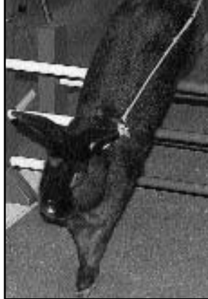
Black Male, litt av en veteran - over 8 år gammel!

Black Male er sønn av min første hoppekanin Trampe. Trampe var en viltblå dvergvedder som ble parret med vår kvite angora Lagberta. Av den blandingen kom altså kosegutten min, som ved første øyekast kan ligne på en trønder. Han ble født 15. juli 1997, så han er altså over 8 år. Han har vært elite i alle grenene, men uten store prestasjoner. Det beste er 80 cm i høyde (på trening) og han har et sertifikat i høyde. Etter at han ble veteran, ble han nr 2 på LU-03 i Sarpsborg, NM i krocket bane. Han er i god form og trives på hoppebanen. Det går ikke så fort, for her skal det snuses, særlig i første omgang. Han får sjelden rivningsfeil, men med all snusinga blir det lett korrigeringer. Under siste konkurranse på Midnorsk Mesterskap, hadde han bare en feil fordelt på to omganger, og det må da være bra!