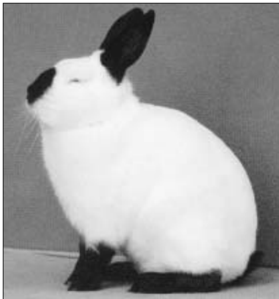
Det blir en del omkring rasen Russer vi skal få lese om i denne spalten i år. Avlsmålet kan jo være denne på bildet, som er fra Sveits

Bilete har eg dessverre ikkje tatt til denne gongen, men eg skal ordne det til neste nummer. Då blir det nok eit kort referat frå LU-opplevinga mi. Ellers har eg planar om å presentere bura våre og dei som bur i dei. Arbeidar med ei fleksibel og flyttbar burløysing i byggekloss-system, ettersom eg enno eigentleg ikkje er etablert nokon plass. Håper dette kan vere interessant for andre å lese. Så må eg finn på nok å skrive om som samstundes er interessant å lese om. - Lykke til med LU-utplukking!