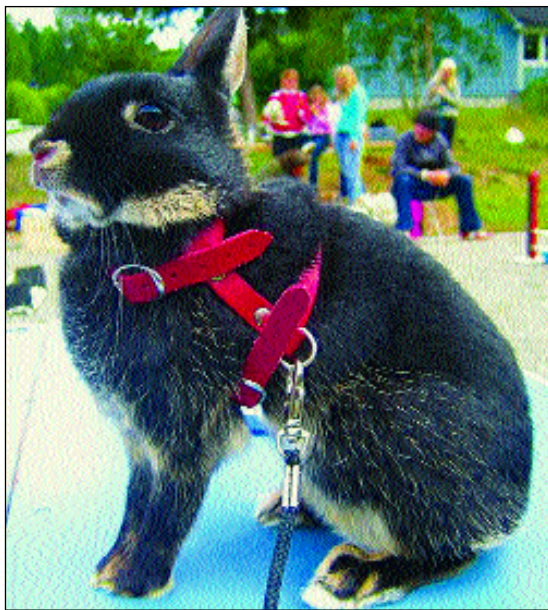
Treasure of Mankind, en av mine to otterfargede dvergharer