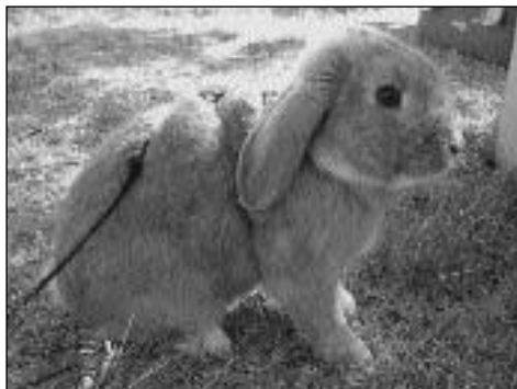
Dalholens Favourite Triumph

- Hva fôrer du kaninene dine med? Hoppekaninene og de andre dvergrasene fôres med vanlig Kaninpellets fra Felleskjøpet. De større kaninene fôres med kuppellets Favør 10. I tillegg til dette fôrer vi med høy daglig og i alle bur er det høyhekk. Gulrøtter eller annet grønt får de en gang i blandt.