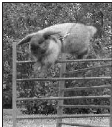
For Desert Girl blir det også nå kun veteranklassen