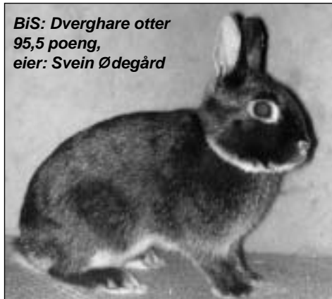
BiS: Dverghare otter 95,5 poeng, eier: Svein Ødegård