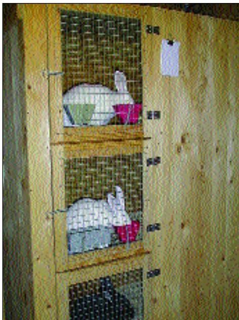
Avlsbura i kjelleren under garasjen

Det er nok mulig jeg tar noen "kombi-kull" etter hvert. Jeg har to Dvergharer otter, som jeg skal ta kull på til våren. De ungene håper jeg skal kunne egne seg som kombikaniner, altså både hoppe- og utstillingskaniner. Dette er også en rase og fargevariant jeg liker godt, og som jeg har lyst til å avle videre på med tanke på