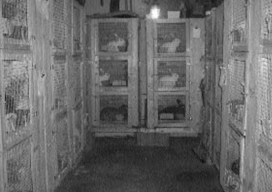
Kaninstallen vår som er i garasjen

har alltid hoppet ganske jevnt og har tatt seg god tid i hver klasse. Han ble elite i høyde i 2003 og i løpet av 2004 var han elite i alle grener. Han har alltid likt å hoppe og hoppegleden har ikke avtatt med årene. Han klarer ikke sitte rolig i buret over lengre perioder.