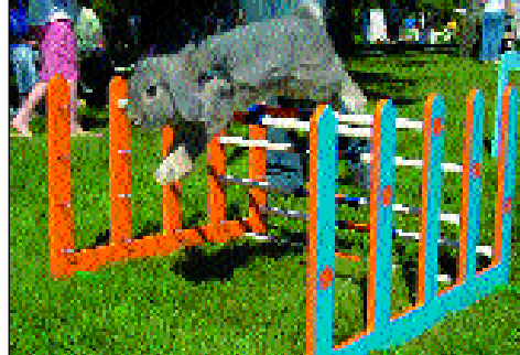
Dalholens Favourite Triumph

utstilling. Jeg avler jo også på rasen Hvit Land og det er kun til utstilling. Da er det kropp og pels som er viktig å ta hensyn til. Avler en for eksteriør tror jeg det er viktig at kaninene utfyller hverandre godt og veier opp for hverandres svakheter.