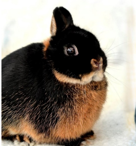
FEL- otter med rufus r 1