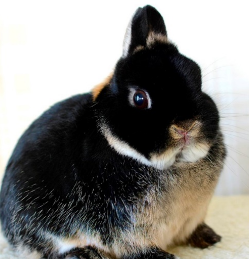
KORREKT - otter med ingen rufus