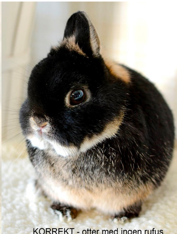
KORREKT - otter med ingen rufus