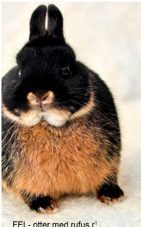
FEL- otter med rufus r 1