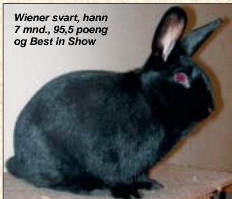
Wiener svart, hann 7 mnd., 95,5 poeng og Best in Show