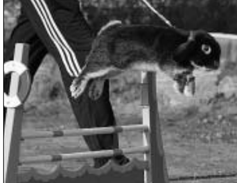
Hedda og Tobøls Sweet Brownie «Ottar»