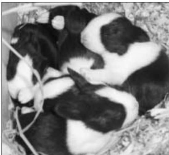
- og søte er de jo

kanin som de også kunne stille ut (hadde det vært en jente ville den ha blitt her). Han ble hetende Sune Sukkergryn etter en kanin i en barnebok. Resten av kullet fikk navnene Sara Solsikke, Silje Silkestrå, Sølvi Snøsøte, Simen Sisselrot og Stian Skogstjerne. To av jentene hadde alt for mye svartanlegg, og ble solgt til en gårdsbarnehage nedi bakken her. Der gjorde de stor lykke med sine artige tegninger og dønn solide gemytt. Sølvi havnet på