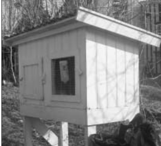
Her bor Pixie

Jeg kjøpte Pixie (Ekelys Desert Nymph) fra jenta som jeg først snakket med. Pixie har jeg enda, og ga mitt første kull i fjor sommer. Det ble seks små sorthvite nøster, søte som sukker. Alle ble trivelige og snille kaniner, og spes en av dem var veldig fin utseendemessig. Han ble solgt til en flott familie som skulle ha en kose-