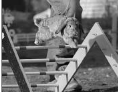
Silje og Skogbakkens Strauss