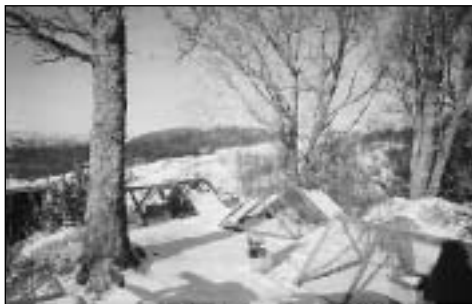
Snøen var såvidt innom oss her en dag

Vinteren kom nylig til oss, men forsvant like fort som den kom. Jeg skal prøve å lage litt julestemning rundt bildene til desemberinnlegget, så får håpe det er noe