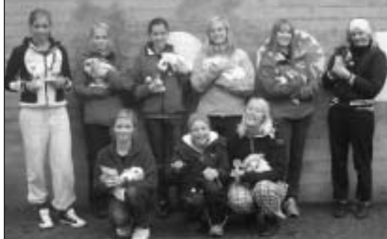
Nesten hele den blide hoppegjengen samlet etter konkurransen

19. oktober arrangerte Stavanger kaninhoppere første konkurranse siden januar. Flere nye ivrige hoppere ville prøve seg. Vi hadde besøk fra Bergen og Haugaland. Rett bane lett var første klasse ut og vi var spente på nivået på kaniner og førere, siden det var første konkurranse for de fleste. Vi kunne se på de fine føringene at de hadde lært noe. 6 pinner ble utdelt, med Heidi og "Underholdning fra Furukollen" i tet. Rett bane middels: "The Blue Keiko" og Ellen Elise vant etter to flotte løp. Krokett bane lett var største klasse med 19 kaniner (ble utdelt sju pinner). "Underholdning fra Furukollen" var i slaget og vant også her. Høyde, ikke elite: Her vant "Blacky Chill" og Silje Therese. I pausen hadde noen av hopperne motevisning av kanindekken som de selv hadde laget. Vi fikk se flere stilige og en kanin stilte i bunad. Vi avsluttet med høyde elite og "The Blue Keiko" og Ellen Elise seiret også her! Så var det rydding og premieutdeling. Da sees vi vel snart igjen på flere konkurranser om ikke så lenge.