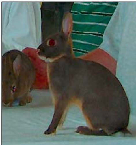
En viktig detalje for Dverghare er riktig kvartcirkel og en fin ryggbue