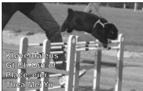
Kløverdals Gt Ch Out of Place, eier: Thea Mei Yu