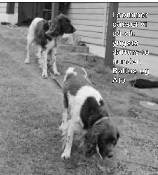
i sommer passet vi på vår yngste datters to hunder, Baltus og Ato

Rognebærene er røde og bjørken slipper bladene. Sauene er på vei hjem fra fjellet. Selv har jeg redusert kaninstallen min betraktelig. Åtte fine Angorakaniner er det jeg har igjen nå. Fire huer og fire hanner. To av hannene skal selges. De er hvite og har gode aner bakover. Ellers er der en gul han og en gul ho, en blå han og en blå ho, en hvit han og en hvit ho. Disse er ubeslektet og jeg håper at jeg får mange fine unger til våren igjen. Ellers har jeg solgt noen, andre er i fryseboksen og blir god mat utover høsten og vinteren. Jeg mener det er bra å ikke ha for mange kaniner om vinteren, det er bedre å få mer tid til å stelle godt med dem som en skal ha å stelle med i høst og vinter.