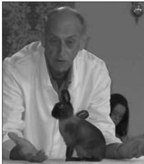
Detaljer er viktig for at en Dverghare skal være bra; - rett linje fra øretipp til framlabb, ørelengde er det samme som fra øreroten til nesetipp, og ørene skal sitte tett sammen