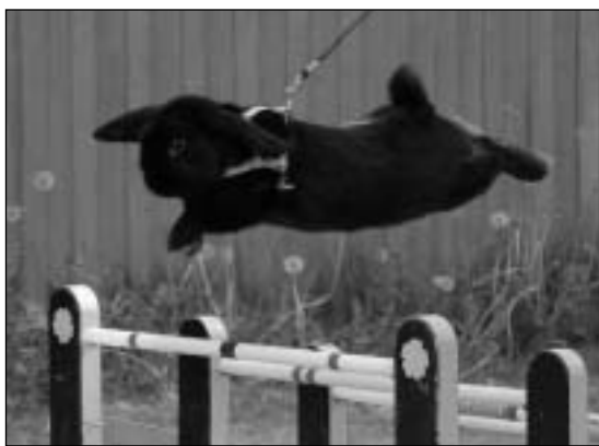
Kløverdalens Great Ch Out Of Place, eier Thea Mei Yu