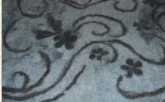
Tovet flak av angora

det samme sted og helg også til neste år.