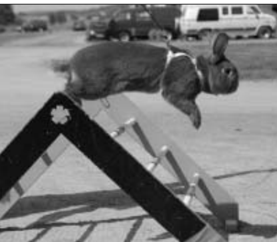
Ilebrekkes Bringer of The Light, en Sachsengold som eies av Siw Hauge