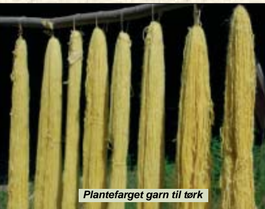
Plantefarget garn til tork

Frya Leir var en flott plass å ha sommer-samling, så kursdeltakerne ønska å bruke