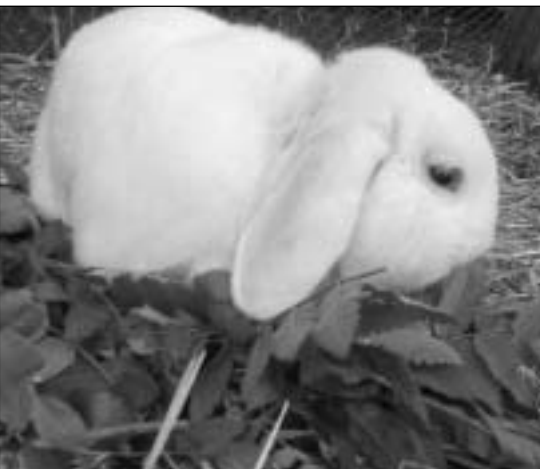
Lysfjords Wilhelm koser seg med blåbærlyng og lauv fra rogn - og slikt triveselfôr gis jevnlig til alle mine kaniner

Basic 15/23 er et oppdrettsfôr beregnet på gravide og lakterende (diende) hunner, samt unger i vekst opp til 6 mndr. Ingen kaniner har etter at jeg skiftet fôr hatt antydning til løs avføring. Jeg har ikke belegg for å si at diaré hos mine kaniner skyldes fôret, men trolig kan det se ut som fôret har vært en medvirkende årsak, siden alt annet har vært holdt konstant i min fôring og håndtering av kaninene.