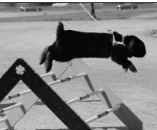
Granlibakkens Sarkasme, som eies av Selma Tandberg