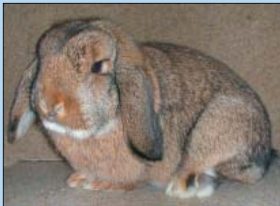
Merete Enghs Dvergvedder hu som får 95,5 p (38-9-9). Merete stilte med 26 Dvergvedder hvor nesten samtlige oppnår gode poeng, og hvor også flere av dem var satt for salg, så der var topp kvalitetsdyr å få kjøpt av Merete!

Oddmund Veka hadde de klart beste dyra i Thyringer, og alle de 5 Thyringer som ble tildelt 95 poeng tilhørte Oddmund.