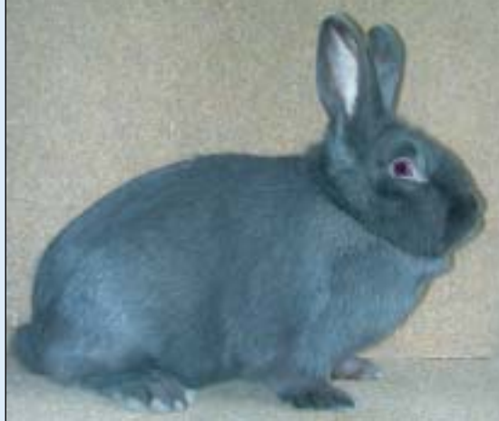
Blå Wiener, hu, til Kai Tveten, 95,5 poeng (38-9-9,5) 8 mnd. - Under: De 3 beste juniorer, fra v.: nr 2 Malin L. Berntsen, Tan 285,5 p, nr 1 Merete Engh, Dvergvedder 286 og nr 3 Ray- mond Netland, Hermelin chinchilla 284,5 p.

lere og 119 kaniner, og arrangøren Drammen hadde 12 utstillere og 101 kaniner.