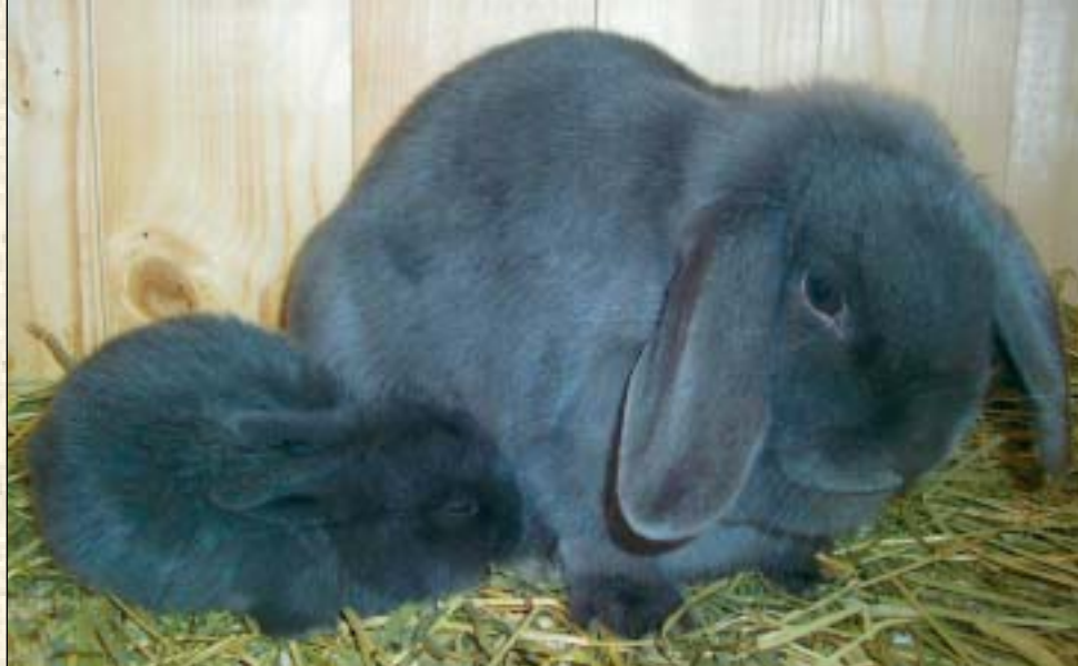
Golddigger med en av ungene sine fra det første kullet

for fremvisning av bilder og annet kaninskryt, avstemninger om kaninhold, og det holdes også månedlig fotokonkurranse innenfor forskjellige temaer.