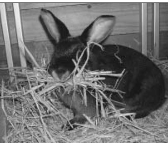
Reirkasse er satt inn og den kommende kaninmor er godt i gang i sitt arbeid med å lage til et reir av høyet som er lagt inn i buret

Husk å før opp dato for paringen (forventet fødsel vil jo nå skje etter 31 dager). Samtidig noterer en ned alle ørenummer på de to kaniner.