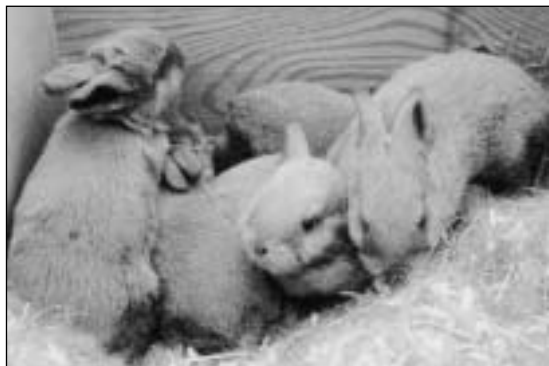
Ungene har fått øyne og godt med pels, de er klare for å søke ut i buret på leting etter mat

begynner kaninmora å sterkt minske sin melkeproduksjon. Ungene blir derfor nå mer og mer å se ute av reirkassen og er i buret på leting etter mat. Ikke legg inn vått gras, salatblader og lignende. Selv om ungene liker dette veldig godt, så kan det dessverre føre til tragisk utgang, da deres mager ikke er i stand til å ta inn slik føde. De får lett diaré, som kan føre til døden. La de derfor få noe tørt å gnage på, som f.eks. en god og hard kneippbrødsalk og selvsagt også tilgang til godt tørt høy.