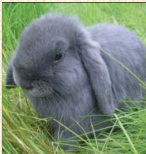
Et ungdyr er ute på en luftetur

For å kunne delta på Norsk Kaninforum må man være registrert medlem og inn-