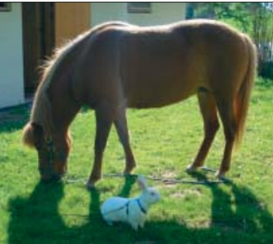
Askja og Rexhannen koser seg på plenen

- Så til noe merkelig(?) som har forekommet hos meg for tredje gang. I fjor kom det 2 kull med døde, slappe unger. Hoene var i nær slekt, så jeg tenkte det lå noe i slekta. Men ved ett kull her i år, der skjedde det samme; 4 unger, som har skikkelig benbygning og alt, men er utrolig slappe. Dødsstivheten kommer veldig sent. Jeg mistenker at det har noe med varmen å gjøre. Denne gangen var ikke kullet i slekt med de 2 i fjor, men alle 3 kull er født når det var ganske varmt. I fjor var det 1 av 3 unger i et kull som var fastere i "fisken" enn resten, men den døde etter et par dager. - Er det noen som vet hva dette er?