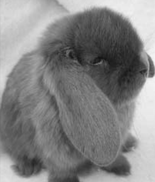
En av ungene fra det første kullet i år

opnådd 92 poeng på utstilling. "Stratos" har dessverre veldig svak ørestilling, men søt er han! «Bossi» hadde det med å ofte stikke av - og da mener jeg ofte! Så fort hun fikk sjansen tok hun seg en tur bort til naboens hage, gjerne for å hilse på nabokatten. Det førte dessverre til at hun en dag kom seg ut av buret og forsvant. Til tross for en hard start på kaninholdet, fortsatte jeg med kaniner. Jeg meldte meg også inn i NKF, som medlem i Askim og omegn kaninavlsforening.