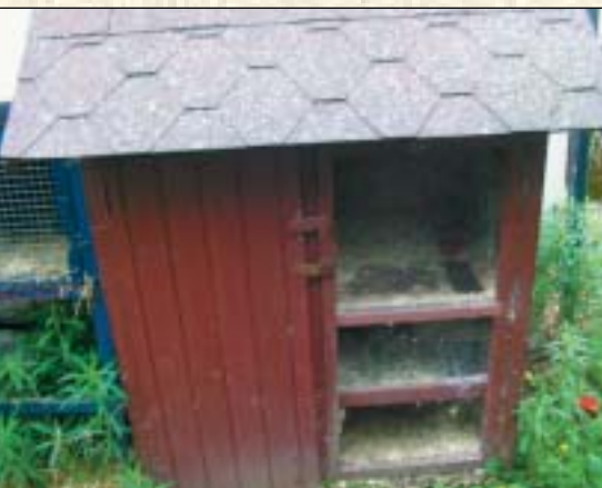
Dette er uteburseksjonen min, men den skal bygges om nå i sommer

logget. Det godtas ikke anonyme medlemmer her, så for å få full tilgang til alle forumene må man undertegne innlegg med fullt navn hvis man ikke har navn i brukernavnet eller andre alternativer.