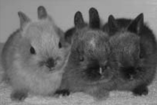
Ett av årets kull - den ene fikk hvite avtegn

- Ellers går dagene utrolig raskt. Varmen som har vært har ført til late dager inndørs for meg, da jeg er litt forsiktig med sola og varmen. Bare om kveldene har jeg orket å gjort noe. Men med lavere temperatur kom "redebyggingen" min i gang, og jeg holder på å forberede barnets ankomst mer enn tidligere. I kveld må jeg forberede de siste kaninene på deres fødsel, skifte på bur og sette inn kasser. Da er hovedsesongen for fødsler over for denne gang. Det kan alltid hende jeg setter på kull senere i år, det vet jeg ikke ennå.