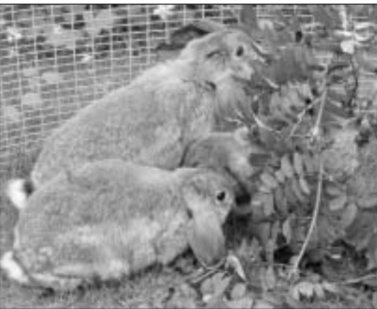
Ungdyrene vokser til, og er ute på «luftetur» og tar til seg av frisk rognbærlauv

Nå er vi kommet dithen at unge-kullet går for seg selv. På burkortet som nå henger på burdøra til ungene har du der notert ned hvem som er mor og far, samt ungenes fødselsdato, kullets ordensnr., antall unger som ble født, antall unger ved f.eks.