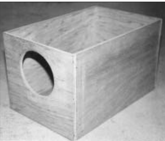
Løs reirkasse som settes inn til hua en uke før forventet fødsel (da med påmontert lokk). Størrelse er: B30 cm x L35 cm x H30 cm og kan anbefales til små og mellomstore raser

fordi den skal bygge opp eggceller - og etter ca 7 dager har fostere startet med sin utvikling.