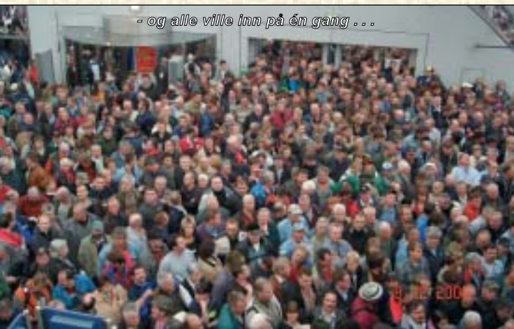
- og alle ville inn på én gang . . .