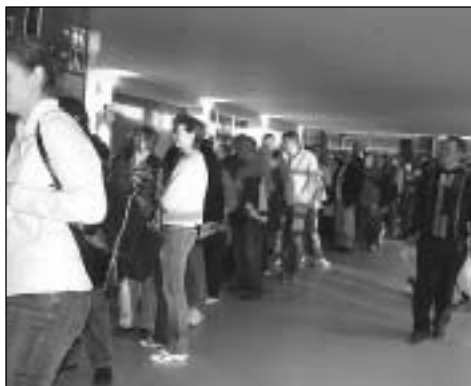
Lang kø foran salgslukene - opptil 250 meter!

I hallene var det mye publikum på fredag, men på lørdag var det mange - mange flere. En måtte nærmest bane seg vei. Vi er jo ikke akkurat vant til slike forhold