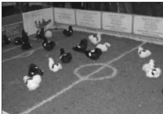
Og hva er så dette? - Jo, fotballkamp!