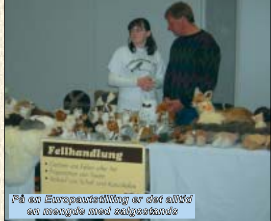
På en Europautstilling er det alltid en mengde med salgsstands

Mattilsynet godkjent. Det neste problemet som oppstod var at vaksinen ikke fantes i Norge, den måtte importeres fra England og dette tok tid, lang tid. I tillegg var forutsetningen for at det skulle tillates vaksinerer, at dyra måtte stå i karantene i Norge fra de var vaksinert til de skulle reise fra landet. Denne karantenestallen måtte forhåndsgodkjennes av Mattilsynet og den ble også besøkt underveis. Utover dette måtte vi ha fraktekasser som også skulle tilfredsstillte visse krav mht. størrelse osv., og de skulle ikke være brukt tidligere. Avslutningsvis ble fraktekassene plombert før avreisen mandag morgen 4. desember, og skulle være plombert til de