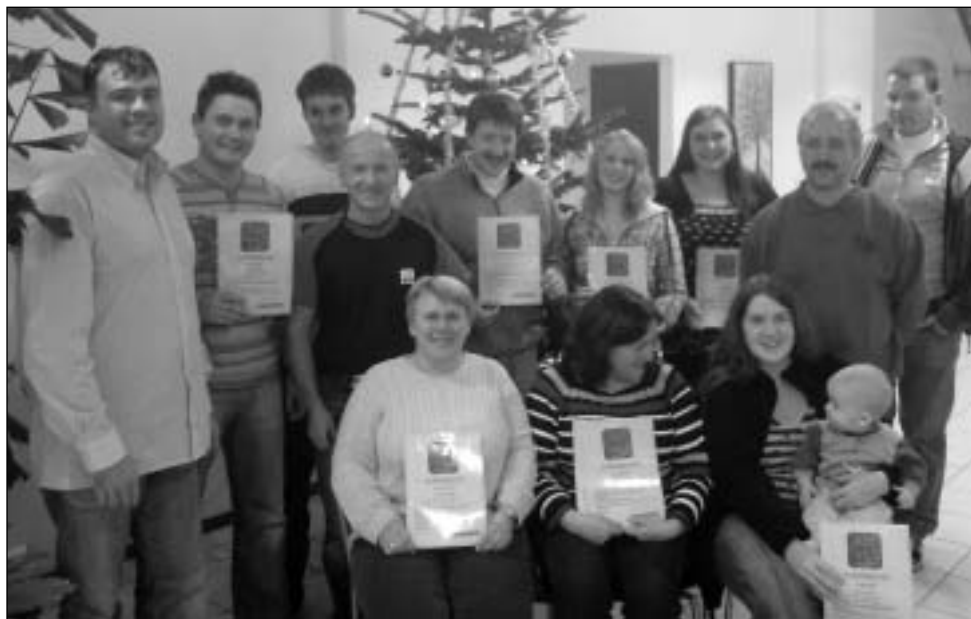
Instruktører og kursdeltagere med sine kursbevis.