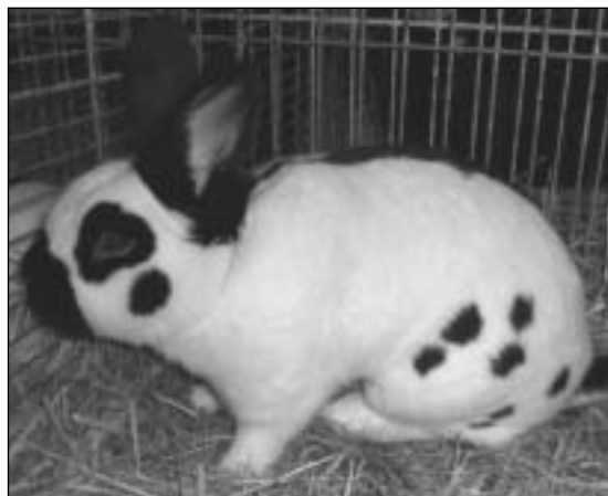
Liten Tysk Schecke, denne rasen imponerer med fine tegninger og god pels

Perle Ekorn: Her var det stilt ut 127 dyr, hvorav fire norske. Her var det mange fine eksemplarer med bra rasepreg og kroppsform, og heller ikke så verst pels