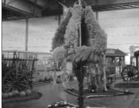
Det var ikke gjort så mye med pynting (i kaninhallen var det kun burrekker), men hos fuglene fant vi da noe. T.h.: Men køer var det nok av . . .

kommer folk fra mange nasjoner. I utstillingskøen utforbi snakket jeg blant annet med en "duemann" fra California, USA.