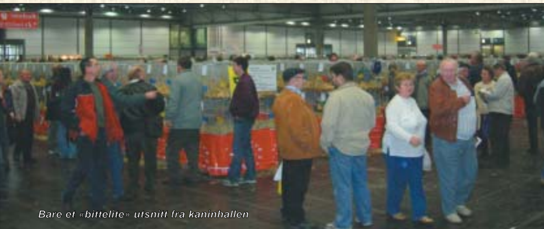
Bare et «bittelite» utsnitt fra kaninhallen

var ute av landet. Poenget med plombering var at en skulle være sikker på at de vaksinerte dyrene ble fraktet ut av landet, og av den enkle grunn at det ikke er tillatt med RVHD vaksinerte dyr i Norge. I henhold til regelverket skulle vi vise papirer, kasser og få stemplet fra svenske myndigheter om at kassene var brakt ut av Norge i plombert tilstand. Når vi kom til tollstasjonen på svensk side var problemenes tid tydeligvis ikke over. På tollstasjonen fant man ut at dette hadde ikke noen greie på og søkte på nettet for å finne informasjon. Etter en god stund fant de fram til et skriv som de mente sa noe om at det kun var lov å transportere tre