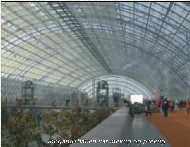
Inngangshallen var mektig og prektig