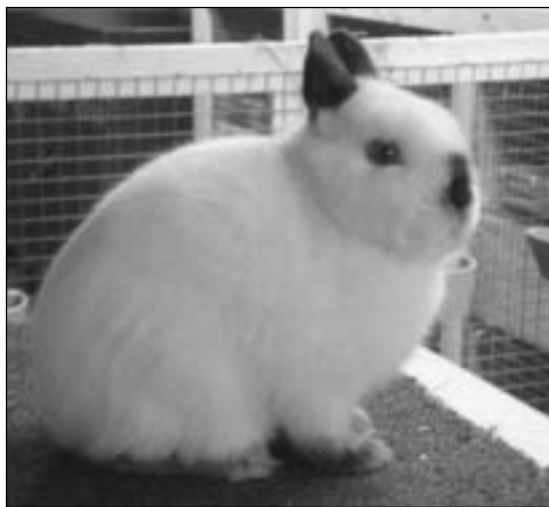
Dette er «Lilleprins», en selvavlet russerhann T.h.: To Hermelinkull, 4 russer og 2 brun zobel