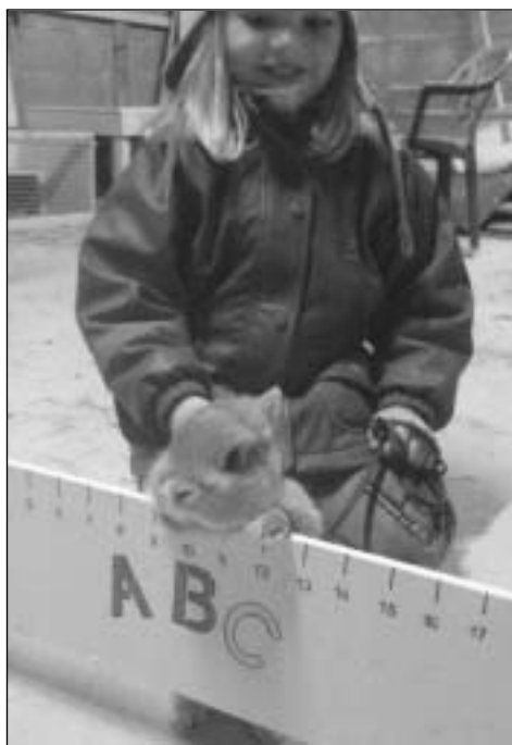
Pikachu lurer på: Kommer jeg over dette mon tro?