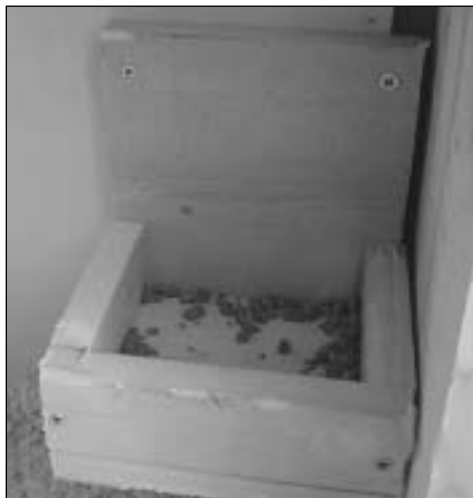
Hjemmelaga fôrskål i tre montert i buret