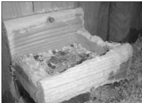
Fôrskål i tre kan de bare gnage på