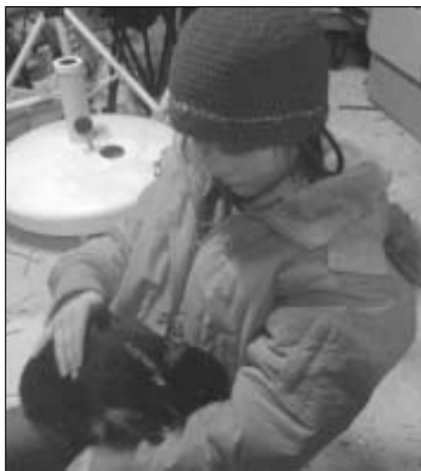
Sara og Stjerne venter på tur, mens Stjerne tar seg en hvil

I etterkant er det nå slaktning av de dyra jeg ikke kan beholde lengre, og totalt 7 dyr skal i fryseren. Av disse 7 var 2 med på LUU - de andre kom aldri så langt. Men med mye jobb og 2 barn (pluss voksende mage), blir nok kaninene prioritert litt ned neste år. Så da får jeg heller velge ut litt nå. 8 russere har plass i reolen min og skal få bli. I tillegg har jeg 1.1 russer som jeg skal ha til etter LU, siden jeg synes de er for fine til å slaktes (enda i alle fall). Er jeg heldig rekker jeg vel kanskje også å få med meg vårutstillingen her, som er