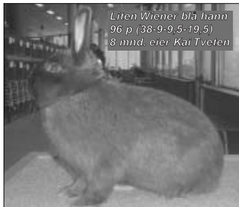
Liten Wiener blå hann 96 p (38-9-9,5-19,5) 8 mnd. eier Kai Tveten