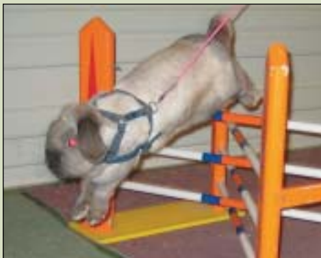
Bjørndalens G.Ch. Heroic Blaze of Vallmon