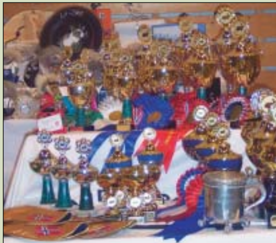
Premiene klar for utdeling til hopperne