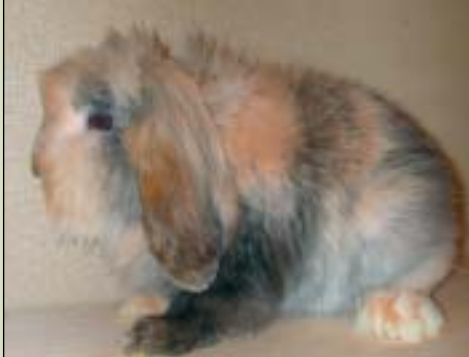
Dette var en morsom krabat, Dvergvedder fuchs japaner, men pelsen holdt ikke til kravet, så den fikk dessverre 0