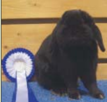
Lia-gardens Casper, til Ina Halsen. 10. i kombi (1. i hopping + 93 p.)