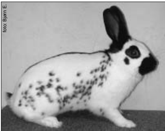
BiR: Engelsk Shecke hann 6 mnd., 95 poeng. Eier Sindre Skeidsvoll

Russer: 2 utstillere med totalt 5 dyr. Hyggelig å se rasen Russer igjen. Mange