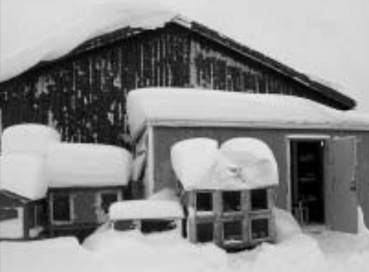
Det kan snø kraftig i Trøndelag! Her er kaninbrakka og bura avbildet en snøværsgdag