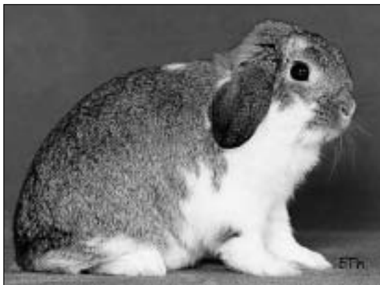
Noen ganger høres denne uttalelse: «Jeg vil ikke ha Dvergvedder viltgrå, for det er så kjedelig farge». Men hvorfor ikke da satse på den kappetegna varianten!

Mange oppdretter har et følelsesmessig forhold til kaninene sine, så det kan være vanskelig å ta vekk et dyr, fordi det ikke har det rette utseende. Om dette er vanlig blant Dvergvedder-eiere, vet jeg ikke. Du som ikke klarer dette med avliving, selg ihvertfall ikke disse kaniner med øremerke og avstammingspapir (stambokblad). Og til dere som kun driver med «hobbyoppdrett», med kjæledyr til salgs for barn