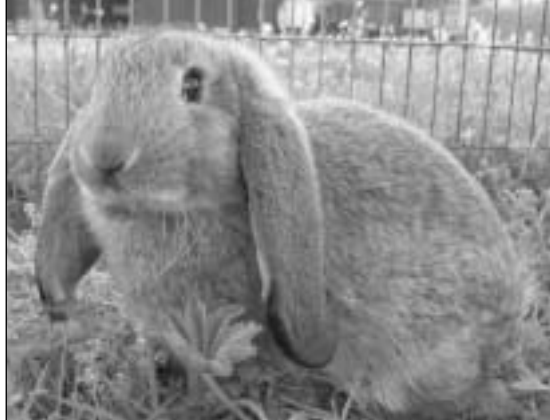
Ett av årets FV-avkom ute i sitt beitebur

får jeg kupellets gratis, så sparer på det). Dette føret fungerer utmerket. Ellers får de mye høy. Vann får de selvfølgelig også. Til alle Dvergvedderne gir jeg FK-kaninpellets, fordi jeg har funnet ut at FK sin pellets «funker» best til Dvergvedderne. Ellers så høster jeg rogn slik at kaninene får noe «kves», dette tørker jeg også og bruker det utover vinteren. De får også gulrot, epler, brød og annet, og om sommeren er det ferskt gras på menyen.