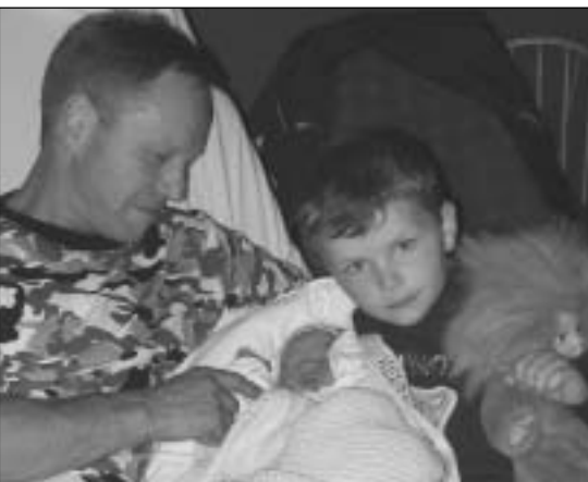
Her har dere alle mine tre gutter

- Da var det ikke så mye mer å fortelle denne gang. Sommeren er en lite begivenhetsrik tid i kaninstallen, det er bare ungene som vokser til. En fortsatt riktig god sommer til alle lesere! - Jonette