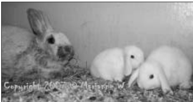
Her er bilde av fostermor og ungene, de er 5 uker gamle og jeg tar dem med hjem

Andre har også hatt slike hendelser, men