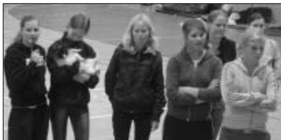
Noen av de lokale hopperne