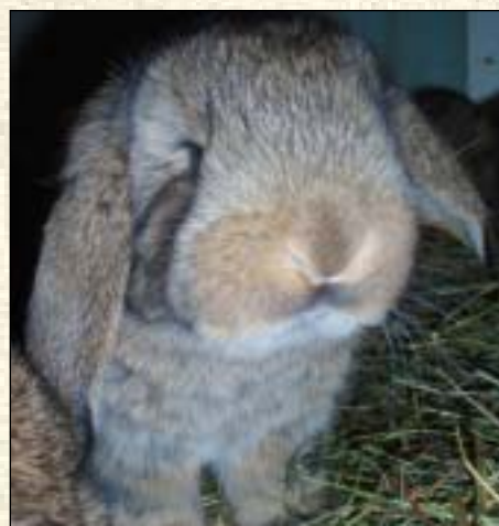
En Fransk Vedder unge på 3 uker. De er jo bare sååååå kjempesøte