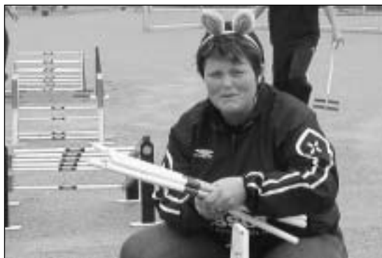
Nei Hilde . . . jeg tror ikke det begynner å regne