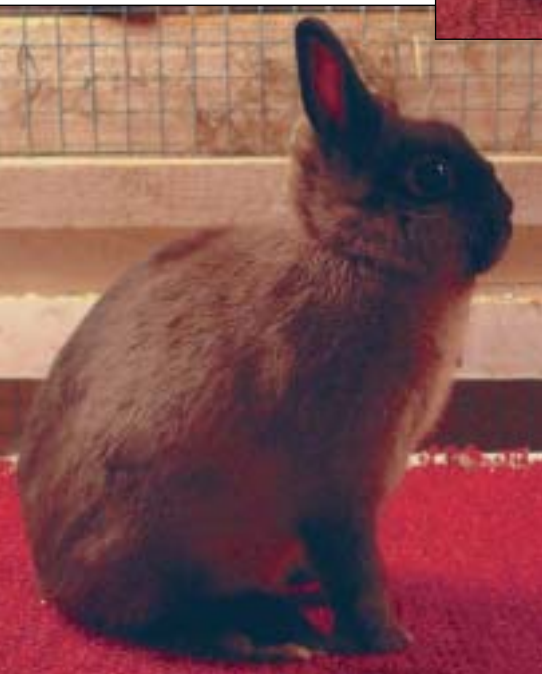
Brun zobel hann - en av de mest lovende