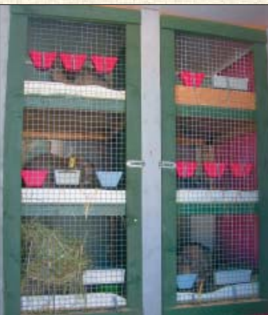
Bura som pappa har bygget

Mitt store ønske var å ha Fransk Vedder. Våren 2003 ble jeg konfirmert og i gave fikk jeg min første Fransk Vedder, så da gikk ønsket i oppfyllelse. På høsten kjøpte jeg en hunn til, og deretter søkte jeg etter