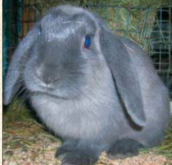
Dvergvedder liker jeg å ha i mange farger, her Bergbys Bamse Mums og Økdalens Helnøtt

den ene labben igjennom nettet, og den måtte avlives. En uke senere var det bilde av han i bladet "Mine dyrevenner".