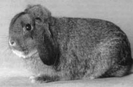
Dvergvedder viltgrå hann. Denne er tysk og som en ser har den godt typemessig rasepreg, med kraftige og god behåring på øreknuter og korrekt krummet hode (neserygg).

et dyr med god type, eller så sitter et smalt hode og dårlige ører på en kanin med kort og god rund kropp. Eller hvorfor ikke en kort kropp, god pels, bra hode og tynne korte ører? Den siste varianten ser man som oftest hos oppdrettere som har kommet litt lengre i sin avl, men har fått med seg de tynne og korte ørene på veien. Man kan også se dem som har en kort kropp, men som har et så smalt forparti at de nesten blir mandolinformet. Glem heller ikke å se på benstillingen. Er det en kanin som viser antydning til inn- eller utoverbøyde framlabber, eller utstående baklabber, så er ikke dette noe å dra med seg inn i en stamme.