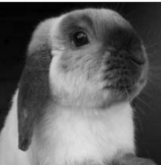
I Dvergvedder avles det bl.a. med siameser

Jeg fører Fransk Vedderne med en «fifty-fifty»-blanding av kupellet og Norgesførs kaninpellets (siden vi har kyr på gården