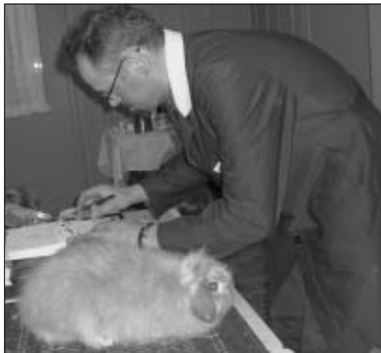
Ikke alle fikk poeng, men denne var da vel søt, selv om det ikke var noe typisk utstillingsdyr.