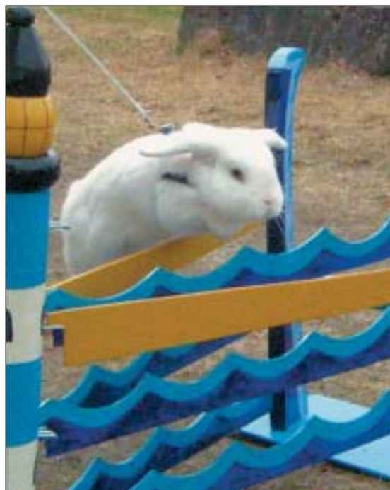
Solbakkenlias Pontuz hadde ei god helg