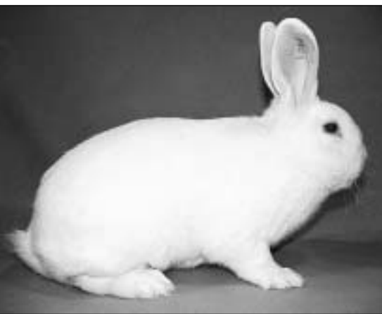
Wiener hvit er en blåøyd kanin, og alle hvite blåøyde kaniner har faktisk en eneste stor hvit flekk over hele dens legeme!

I tillegg finnes det kaniner som er mellomformer av disse samt kaniner som har bare en eller noen få hvite flekker. Disse er ikke godkjente, men de finnes jo allikevel. Den mest ekstreme er de hvite blåøyde kaninene – disse har en eneste stor hvit flekk over hele kroppen!