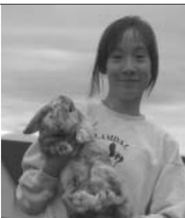
Thea Yu og Bajass var fornøyd med dagen