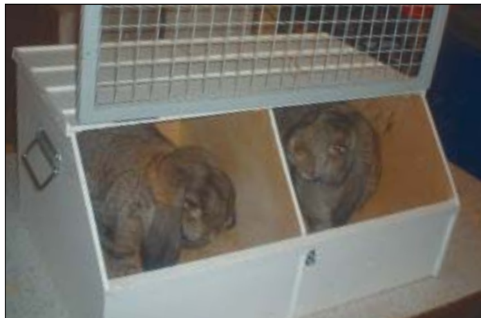
Klar for å reise til Førde, i transportkasse snekra av Ståle Bruvoll