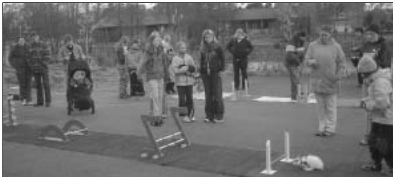
Kaninhoppekonkurranse under høstutstillinga vår i Førde - eg håpar denne sporten kan få fart i kanininteressa hos ungdommen her