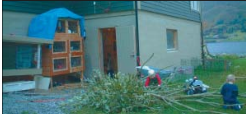
Alle er med å hjelper til med lauving.