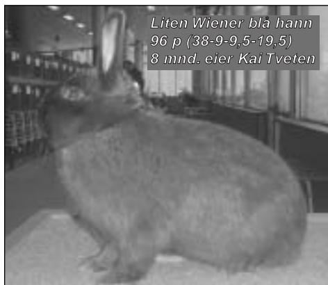
Liten Wiener blå hann 96 p (38-9-9,5-19,5) 8 mnd. eier Kai Tveten